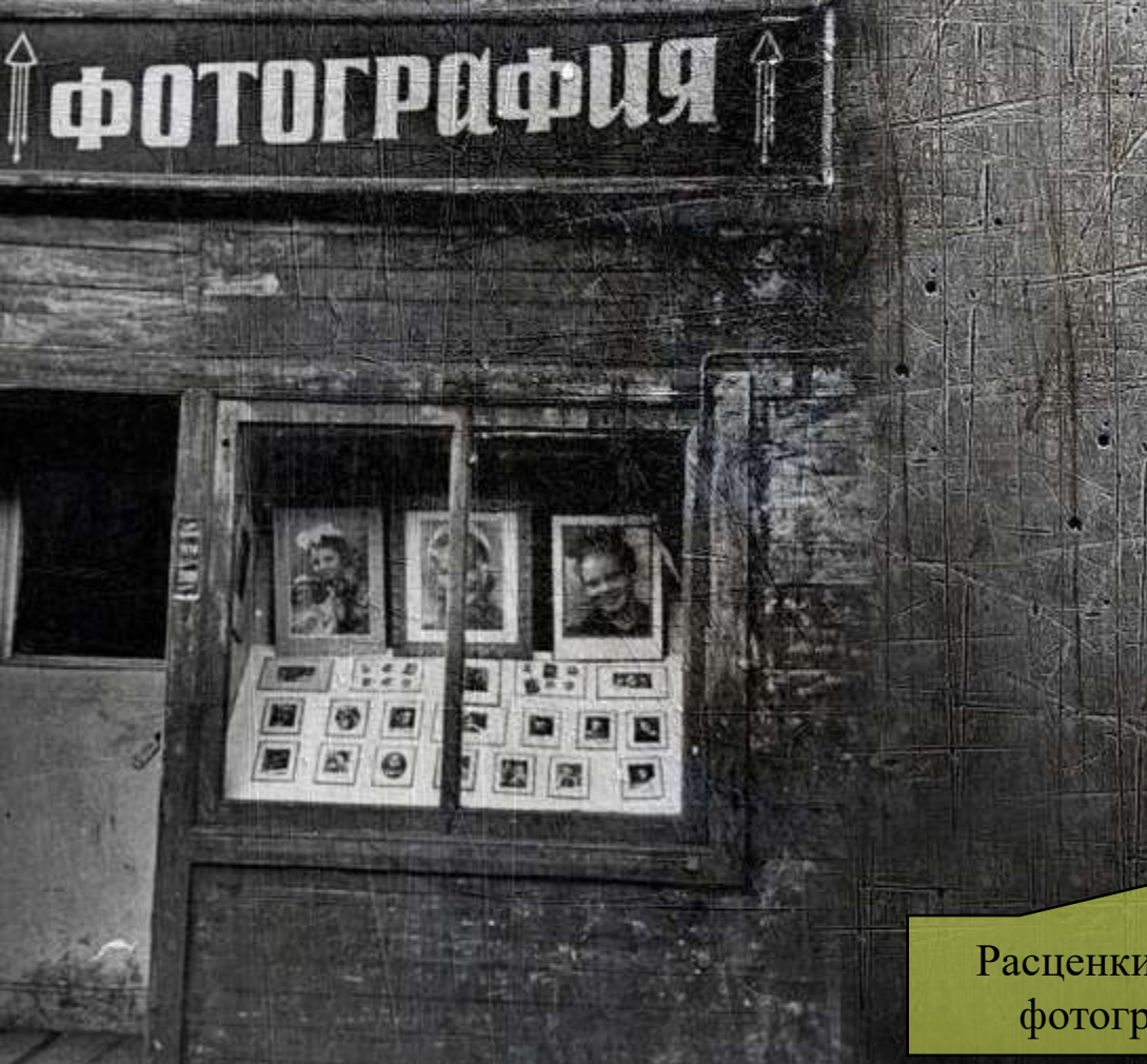
Расценки на фотоработы по фотографиям на 1939 г.

Филиалы фотоателье располагались по ул. Челюскинцев № 9, ул. Владимировской у виадук, на пересечении ул. Гоголя и ул. Каменской.