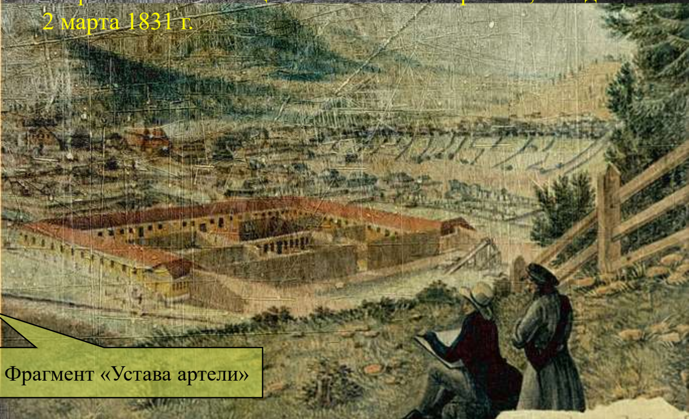
Фрагмент «Устава артели»